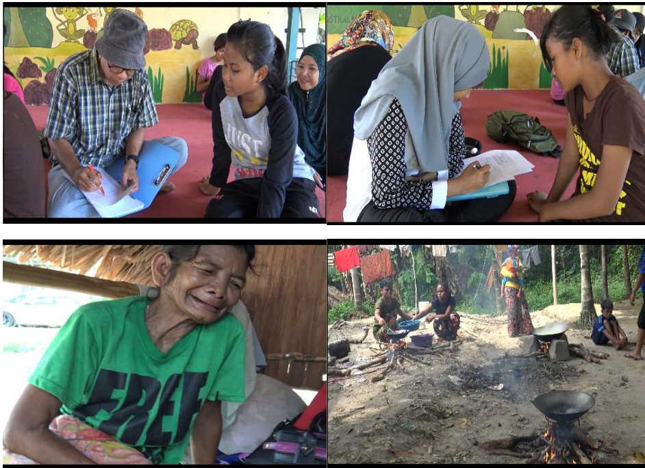
Gambar 1: Masyarakat Che Wong

Bagi menghasilkan sehelai baju kulit yang dipakai oleh orang-orang tertentu dalam majlis atau upacara tertentu ini memerlukan ketelitian dan tumpuan yang tinggi selain melibatkan kerja-kerja yang sangat rumit. Kebanyakan generasi muda tidak mengetahui dan tidak mengambil tahu proses ini. Golongan muda dan belia beranggapan bahawa baju kulit ini tidak lagi digunakan kerana mereka memakai pakaian normal seperti masyarakat Malaysia yang lain. Contohnya dapat dilihat dalam gambar yang sempat kami rakam ketika berada di perkampungan Che Wong seperti berikut: