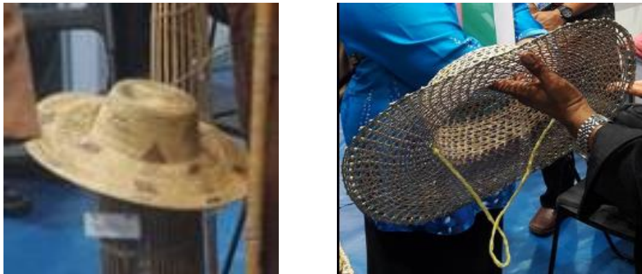
Gambar 2: Kraftangan topi masyarakat Che Wong

Keadaan ini sememangnya menjadi bukti jelas proses penghilangan khazanah masyarakat Che Wong ini.