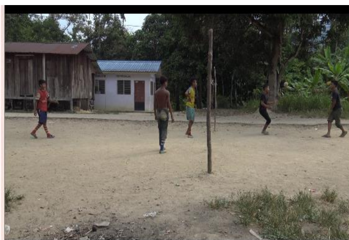
Gambar 3: Golongan belia masyarakat Che Wong sedang bersukan (sepak takraw)

Golongan belia ini juga menyatakan mereka gembira bekerja dengan pihak luar. Contohnya, ada dalam kalangan mereka yang bekerja dengan Pusat Jagaan Gajah yang terletak berhampiran dengan penempatan mereka. Mereka bukan sahaja memperolehi pendapatan tetap malah gembira kerana dapat bertemu dengan ramai pelancong yang melawat kawasan ini. Selain itu, ada juga dalam kalangan mereka yang berkerja dengan individu dan orang perseorangan untuk mengusahakan kebun sayuran dan kelapa sawit. Manakala golongan berusia 51 tahun ke atas iaitu hanya sebanyak 10% masih melakukan aktiviti harian biasa masyarakat ini untuk meneruskan keberlangsungan hidup mereka.